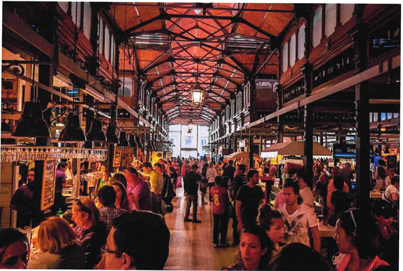
Mercato San Miguel, Madrid

Il progetto Foody 2025 prende vita dalla collaborazione tra Sogemi , società che già gestisce attualmente i mercati all'ingrosso milanesi, e il Comune di Milano . L'obiettivo è a dir poco ambizioso: creare un city food hub moderno e innovativo, capace di competere con i principali mercati europei come quelli di Madrid , Parigi e Barcellona . Collocato nella vastissima area del Mercato alimentare milanese, con una superficie coperta di 47.000 mq e ulteriori 15.000 mq destinati a servizi e pertinenze, questo nuovo mercato sarà grande quanto il Terminal 1 dell'Aeroporto di Malpensa.